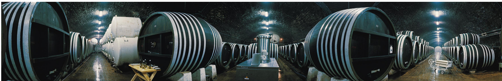
Křížový sklep v Příměticích

sklepě Sovín. Tam je možnost ubytování, stravování i ochutnávky jejich vín. Krajina nás láká k návštěvě hradu Buchlova a zámku v Buchlovicích posazeného do nádherného a dobře udržovaného parku. Ve sklepech tohoto zámku najdete Galerii vín, kde je možné seznámit se za odborného doprovodu nejen s víny této oblasti, ale i s víny ostatních moravských vinařských oblastí. Na Uherskohradištsku kralují mezi víny Müller-Thurgau, Rulandské bílé, Chardonnay a Ryzlink rýnský. Vína těchto odrůd tu mají nezaměnitelný charakter sevřeného projevu chuťových látek s prodlužující se perzistencí, která vyniká zvláště u vín láhvově zralých. Pro tuto zvláštní krásu vín nejsevernějších vinařských oblastí Evropy jsou mnohými ctiteli vyhledávána.