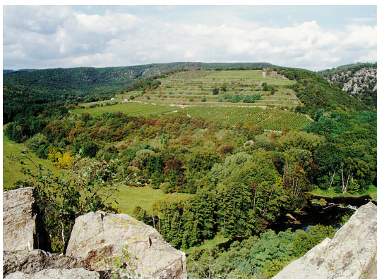
Národní park Podyjí